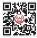
艺博教育官方网站