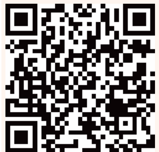
【扫码查看资质公示信息】