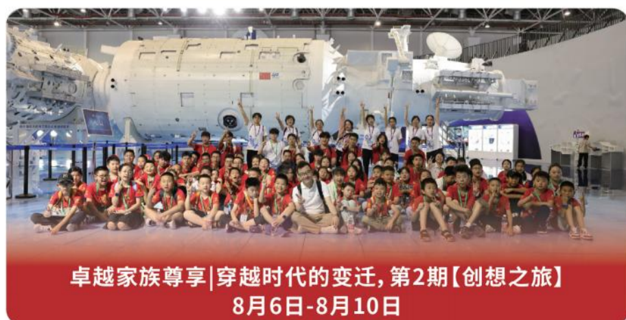
卓越家族尊享|穿越时代的变迁,第2期【创想之旅】 8月6日-8月10日