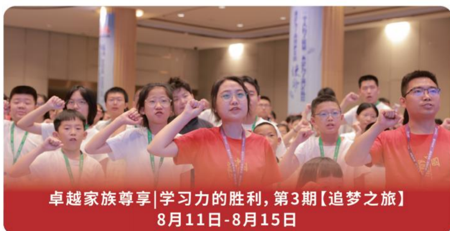
卓越家族尊享|学习力的胜利,第3期【追梦之旅】 8月11日-8月15日