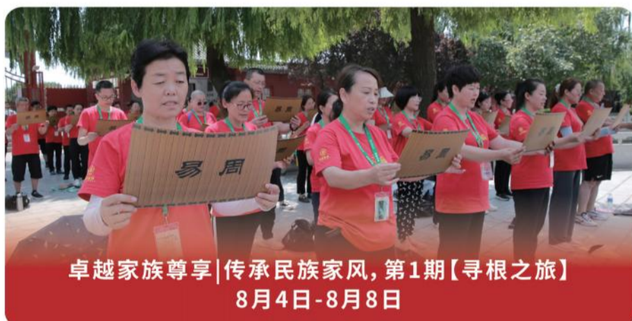
卓越家族尊享|传承民族家风,第1期【寻根之旅】 8月4日-8月8日