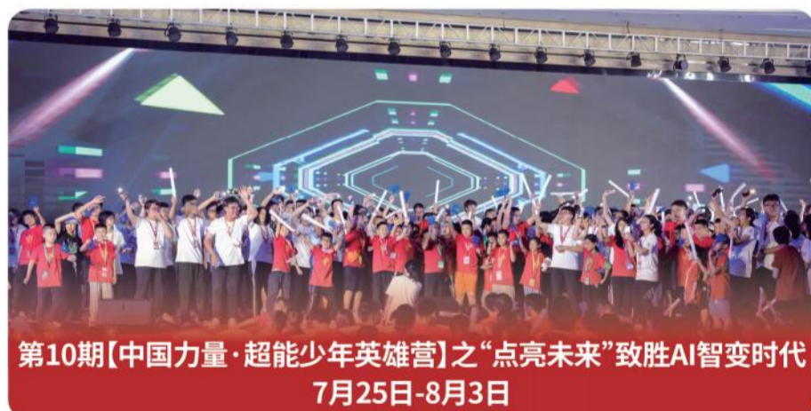
第10期【中国力量·超能少年英雄营】之“点亮未来”致胜AI智变时代 7月25日-8月3日